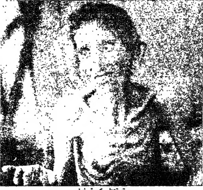
تستعطي كسرة خبز